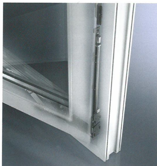
Apparecchiatura a scomparsa: Schüco VarioTec NI Concealed Schüco VarioTec NI fitting