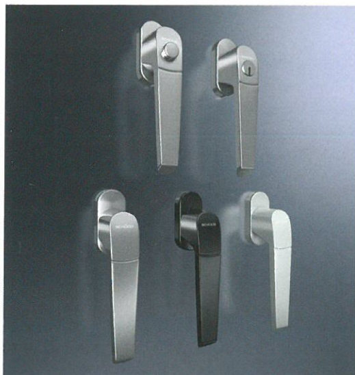
Gamma di maniglie: design Range of handles: design