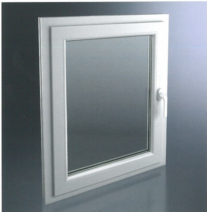
Sistemi di sicurezza non visibili dall'esterno con Schüco VarioTec NI Security features cannot be seen from outside with Schüco VarioTec NI

La nuova generazione di ferramenta Schüco VarioTec NI unisce un design classico e sempre attuale a una tecnologia funzionale e multifunzione. Con un peso d'anta fino a 150 kg, la ferramenta a scomparsa soddisfa le esigenze architettoniche legate alla necessità di disporre di diversi formati offrendo la massima trasparenza. Il sistema di apertura verso l'interno con ante a sormonto sorprende grazie alle sue caratteristiche di montaggio ottimizzate e a un sistema modulare di sicurezza fino al grado RC 2. Abbinati ai sistemi Schüco in PVC e testati secondo le direttive dell'istituto IFT, i nostri sistemi di chiusura sono sinonimi di eccellente qualità e funzionalità. Un sistema che consente di aprire e chiudere la finestra in tutta sicurezza. La protezione antieffrazione è garantita da chiusure con nottolino a fungo in acciaio temprato e da angolari a prova di scardinamento.