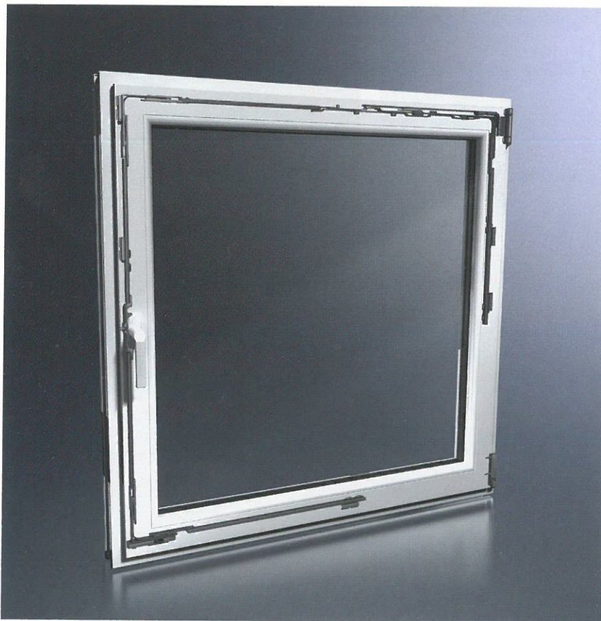
Il sistema di chiusura Schüco VarioTec con robusta tecnologia ad asta di chiusura The Schüco VarioTec fittings system with durable locking bar technology

Schüco è riuscita a combinare con intelligenza i vantaggi di un sistema di ferramenta in acciaio con il principio della chiusura ad asta. Con Schüco VarioTec, il sistema di chiusura ad asta viene integrato con robusti componenti di sperimentata efficacia per ferramenta in acciaio. In collaborazione con un'azienda leader nella produzione di ferramenta, è stato sviluppato un principio modulare che riunisce i vantaggi dei due sistemi e offre elementi di sicuro successo. Schüco VarioTec rappresenta il culmine della tecnologia. È una combinazione unica di acciaio e poliammide, più volte controllata e testata per la quotidianità in tutti i singoli componenti nelle condizioni più difficili. I risultati dei test sono stati confermati da istituti indipendenti. Finestre, ferramenta e maniglie Schüco VarioTec costituiscono un sistema omogeneo e completamente compatibile, unico sul mercato. Tecnicamente ed esteticamente perfetto e versatile. Anche finestre ad arco o di altre forme particolari possono essere realizzate senza problemi e con un minimo impegno di installazione.