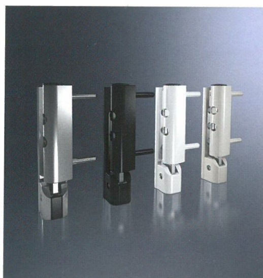
Cerniere Corner pivot