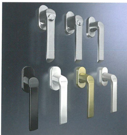
Gamma di maniglie: modelli standard Range of handles: standard